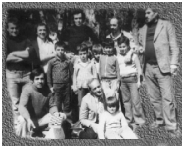
Në këto foto mund të shihni disa nga mësuesit e parë të fshatit Sllatinë.